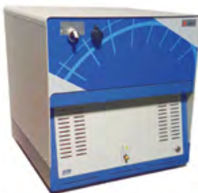
Analizzatore modulare MGC 16