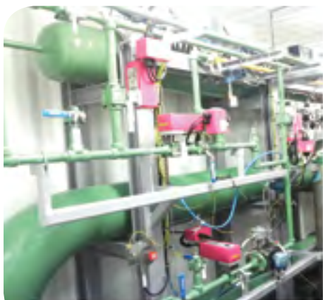
Sistema di stoccaggio e misura MECI

In occasione di BIOGAZ Europa, il 07/02/2018, l'MGC 16 ha vinto l'Open Innovation Award di GRTgaz (trasportatore gas in Francia) per i suoi consumi ridotti di gas campione e le grandi performance analitiche.